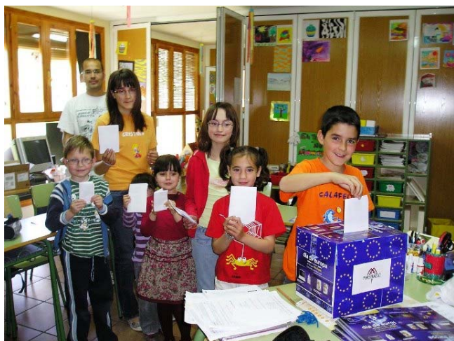
Colegio de Pitarque

Gracias al material promocional enviado por la Comisión Europea y el Parlamento Europeo, los niños del Maestrazgo recibieron varios obsequios (entre ellos, un mini libro con los Derechos Fundamentales del Ciudadano de la Unión Europea) y cada colegio se quedó varios carteles para promover la participación en las elecciones del próximo 7 de junio.