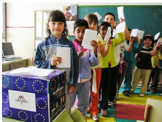
Colegio de La Iglesuela del Cid

El CAIRE también recogió las reivindicaciones de los pequeños para mejorar su municipio, con el compromiso de enviarlas a las instituciones europeas para que tomaran nota de las necesidades de los pueblos del Maestrazgo.